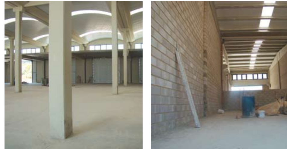
Imatges recents de les naus industrials en les que es pot apreciar el diferent estat

Les tècniques municipals han estat aquest mes d'agost treballant en els últims detalls a la primera de les dues naus industrials que l'Ajuntament ha construït al polígon, amb l'objectiu d'enllestir finalment una obra que s'ha prolongat en el temps més del previst. Aquest endarreriment, atribuïble a una mala construcció per part de l'empresa adjudicatària, ha causat un sobrecoast en la pròpia obra i, a més a més, un retard en la implantació d'empreses. Fruit de la negociació de l'Ajuntament i l'Oficina de Desenvolupament Local (ODL) amb diferents empreses de l'entorn, els 10 locals de la primera nau