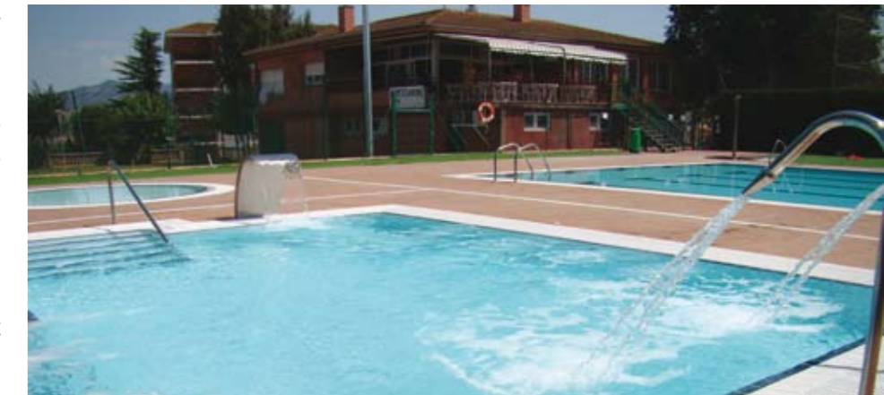
Després d'haver construït les noves piscines, ara l'Ajuntament vol reformar el local social

En una fase posterior, l'Ajuntament completarà aquesta obra amb la construcció d'una piscina coberta a la zona verda que envolta l'actual local social de