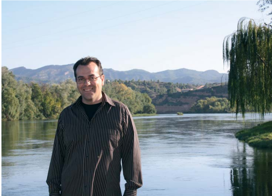
El riu és un dels principals atractius turístics d'Ascó