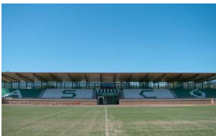
Els antics banquets van ser substituïts per uns de nous amb respatller

De resultes de la normativa que regeix els equips de futbol de 3ª divisió s'han hagut de dur a terme diverses reformes al camp