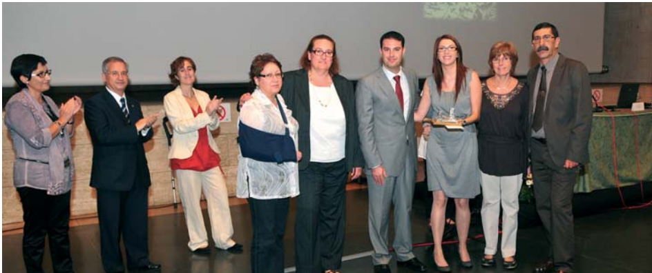
L'equip de V.A.T.

El document en commemoració del IV Centenari de l'expulsió dels moriscos elaborat per la televisió local d'Ascó va guanyar el premi en la categoria "televisió" del II Premi de Periodisme Carmel Biarnés.