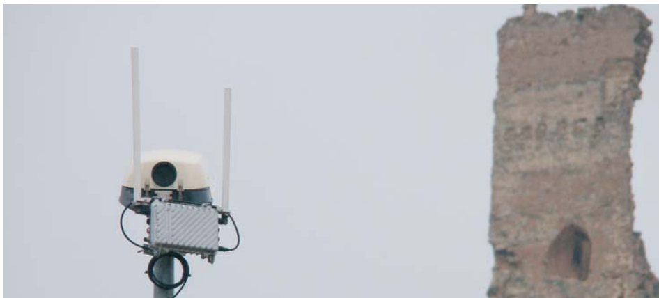
Actualment al municipi hi ha 32 repetidors i està previst instal·lar-ne 14 de nous.

El Consistori té previst fer una ampliació de nous repetidors de wi-fi per tal de millorar la cobertura de la xarxa al municipi. La intenció de l'equip de govern és que enguany n'hi hagi 14 de nous. Actualment, Ascó compta amb 32 repetidors. Aquests es van instal·lar distribuïts en diferents punts del poble ara fa gairebé dos anys amb la intenció de donar cobertura a tot el municipi. Tot i que la intenció de l'Ajuntament quan es va fer la primera