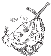
Escola de música