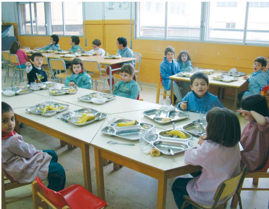
El servei de menjador l'utilitzen una mitjana de 30 alumnes

El col·legi Sant Miquel comptarà amb un nou menjador per als seus alumnes que es podria posar en marxa el curs vinent. Des de l'any 2007, el centre educatiu utilitza una aula equipada perquè funcioni com a menjador. Atès al bon funcionament des que es va posar en marxa, el Consistori ha decidit fer una aposta ferma per aquest servei- que atén una mitjana d'una trentena